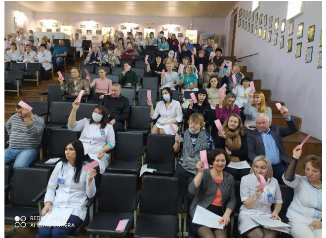
На фото: делегаты конференции слушают доклады и голосуют

Коллективный договор прошел экспертизу в Гомельской областной организации Белорусского профсоюза работников здравоохранения на соответствие положениям Генерального и Тарифного соглашения. В коллективном договоре предусмотрен ряд дополнительных социальных гарантий по сравнению с действующим законодательством.