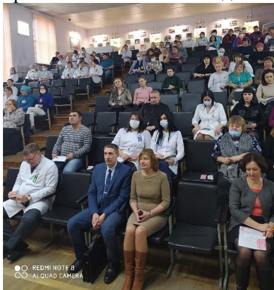
На фото: перед началом конференции

На повестку дня было вынесено восемь вопросов, в том числе отчет о работе профсоюзного комитета УЗ «Жлобинская ЦРБ» за 2022 год, об итогах выполнения коллективного договора УЗ «Жлобинская ЦРБ» за 2022 год, о принятии коллективного договора УЗ «Жлобинская ЦРБ» на 2023 - 2025 годы.